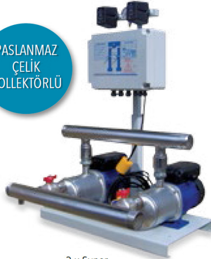
2 x Super