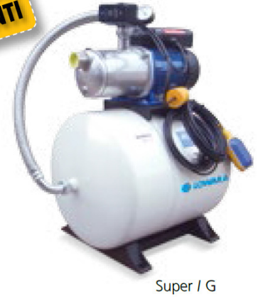
Super / G